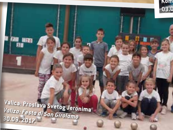
Valica: Proslava Svetog Jeronima Valica: Festa di San Girolamo 30.09. 2017.