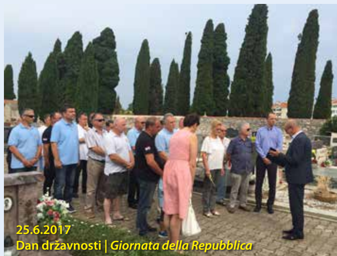
25.6.2017 Dan državnosti | Giornata della Repubblica