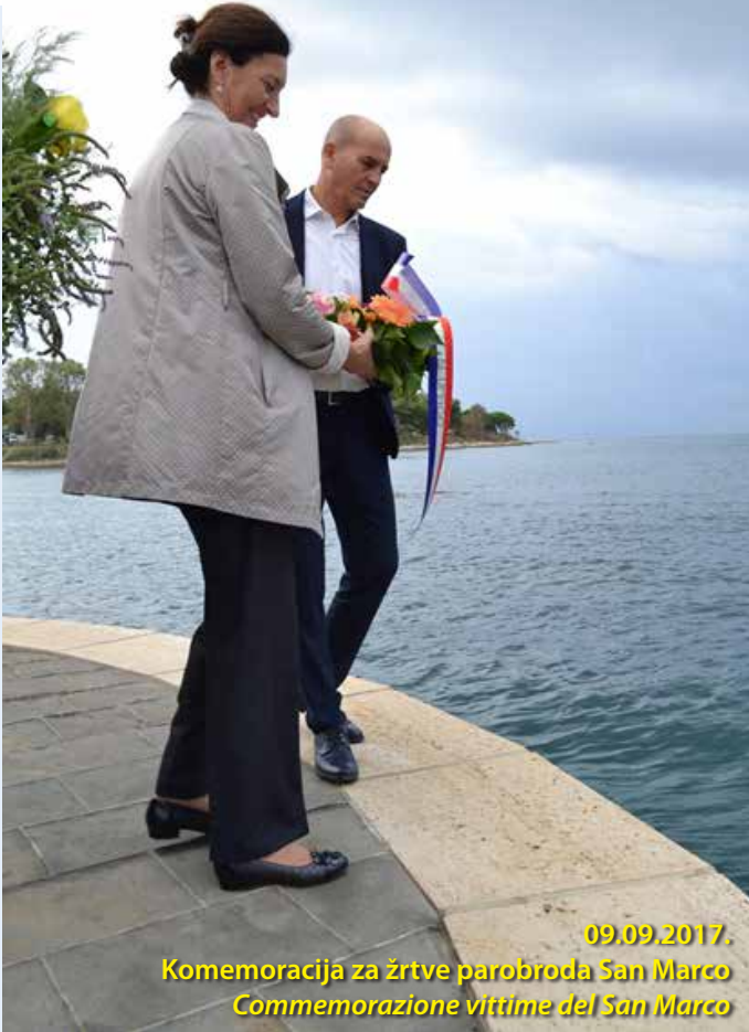
09.09.2017. Komemoracija za žrtve parobroda San Marco Commemorazione vittime del San Marco