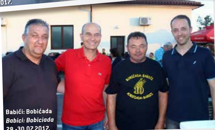
Babići: Bobićada Babići: Bobićada 28.-30.07.2017.