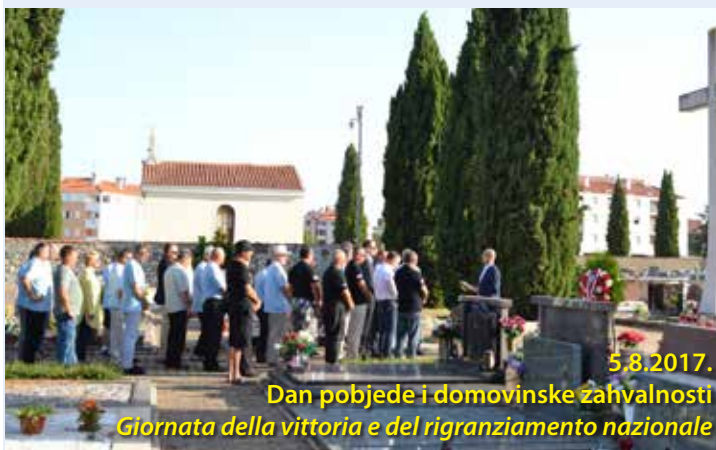
5.8.2017. Dan pobjede i domovinske zahvalnosti Giornata della vittoria e del ringraziamento nazionale