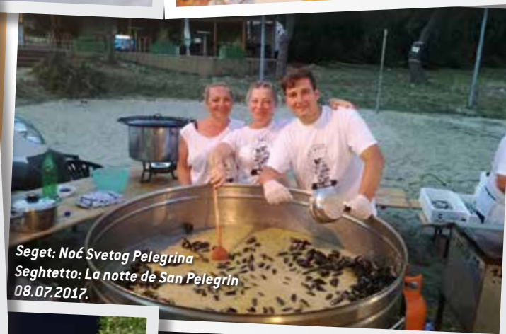
Seget: Noć Svetog Pelegrina Seghetto: La notte de San Pelegrin 08.07.2017.