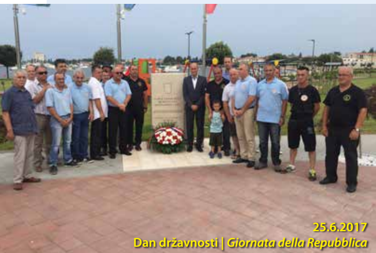
25.6.2017 Dan državnosti | Giornata della Repubblica