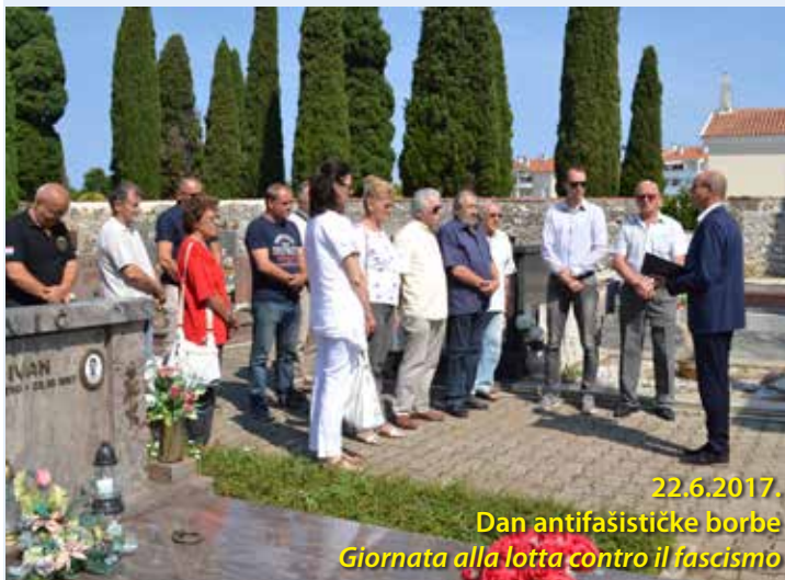
22.6.2017. Dan antifašističke borbe Giornata alla lotta contro il fascismo