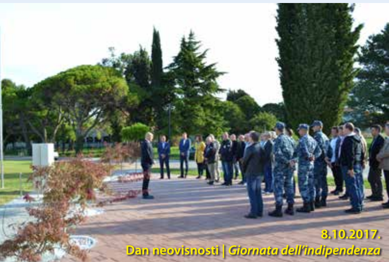
8.10.2017. Dan neovisnosti | Giornata dell'indipendenza