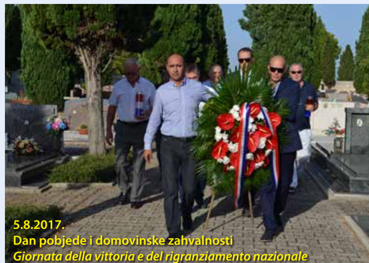
5.8.2017. Dan pobjede i domovinske zahvalnosti Giornata della vittoria e del ringraziamento nazionale