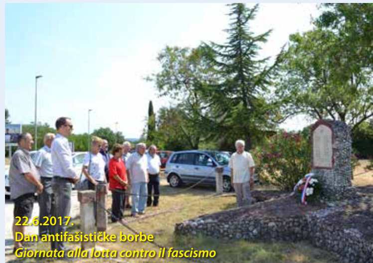
22.6.2017. Dan antifašističke borbe Giornata alla lotta contro il fascismo