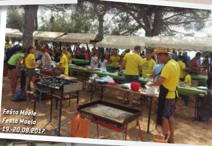
Fešta Moele Festa Moela 19.-20.08.2017.