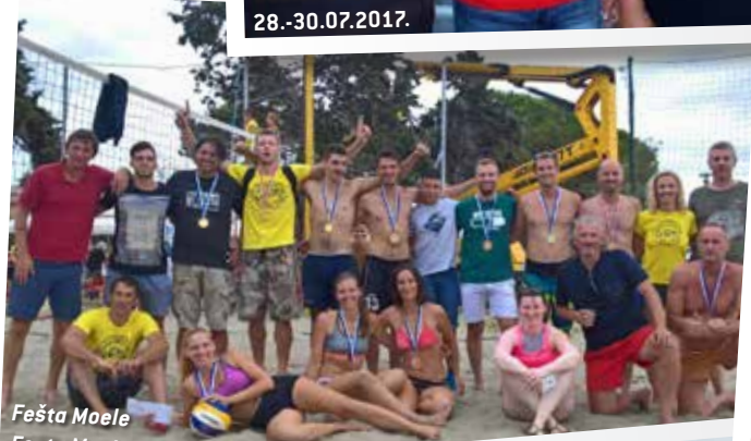
Fešta Moele Festa Moela 19.-20.08.2017.