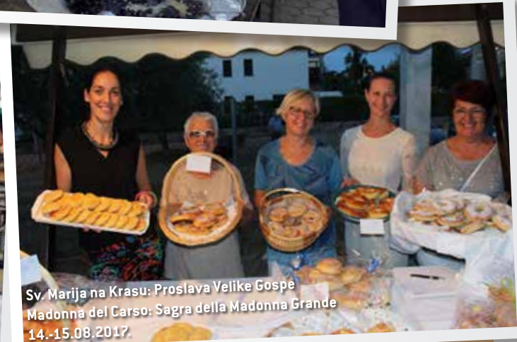
Sv. Marija na Krasu: Proslava Velike Gospe Madonna del Carso: Sagra della Madonna Grande 14.-15.08.2017.