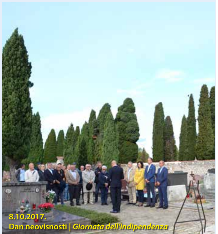
8.10.2017. Dan neovisnosti | Giornata dell'indipendenza