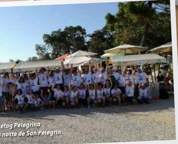
Seget Pelegrina La notte de San Pelegrin