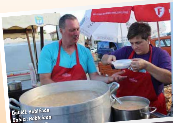
Babići: Bobićada Babići: Bobićada 28.-30.07.2017.