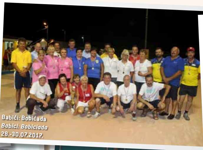
Babići: Bobićada Babići: Bobićada 28.-30.07.2017.