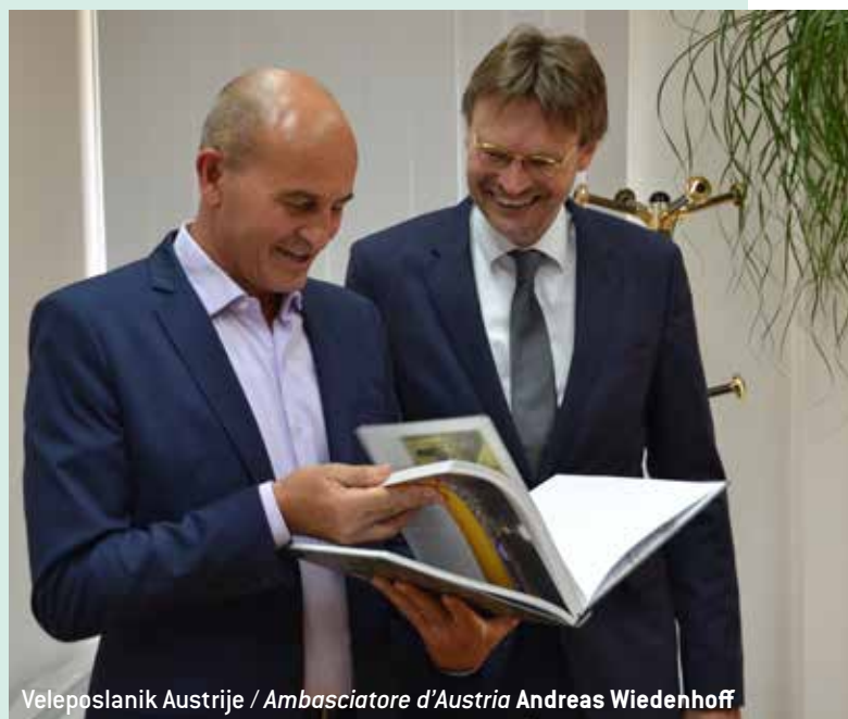
Veleposlanik Austrije / Ambasciatore d'Austria Andreas Wiedenhoff

Gradonačelnik se u posjetima posebno osvrnuo na realizirane i buduće projekte od iznimno velikog značaja za našu zajednicu. Razgovaralo se o gospodarskoj situaciji na lokalnoj i nacionalnoj razini te mogućnostima investiranja i realizacije budućih zajedničkih projekata.