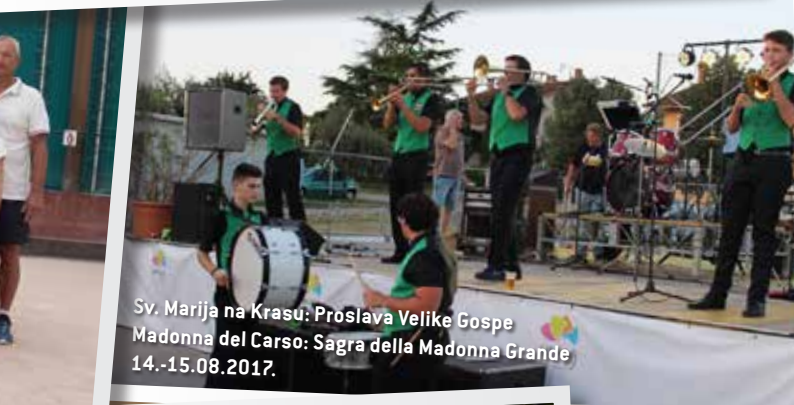
Sv. Marija na Krasu: Proslava Velike Gospe Madonna del Carso: Sagra della Madonna Grande 14.-15.08.2017.