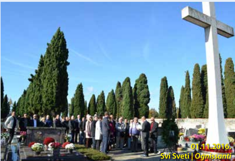
01.11.2016. Svi Sveti | Ognissanti