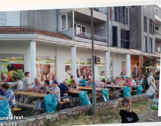
Komunela fest 03.06.2017.