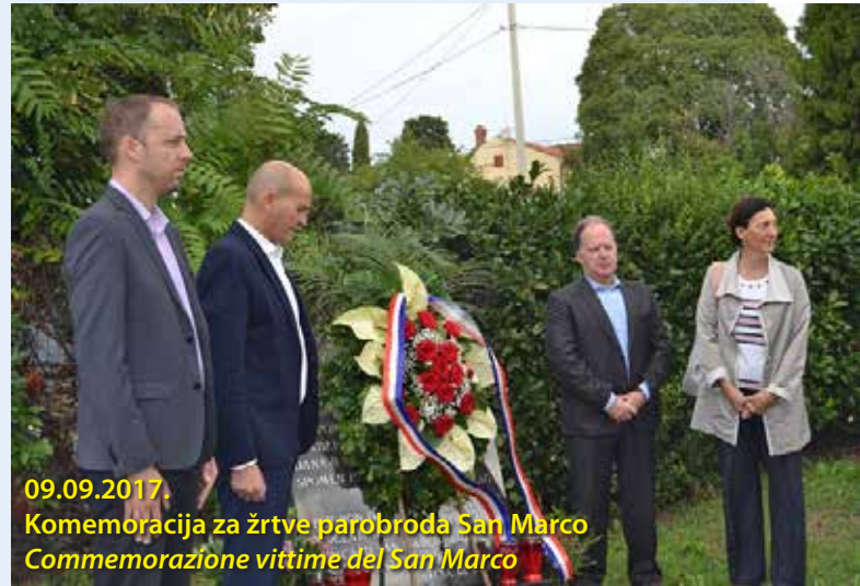
09.09.2017. Komemoracija za žrtve parobroda San Marco Commemorazione vittime del San Marco