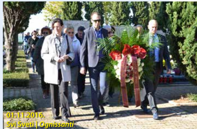
01.11.2016. Svi Sveti | Ognissanti